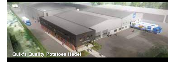
Qulk's Quality Potatoes Hedel