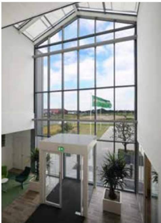
Ruime entreehal in de vorm van een kas

Het nieuwe distributiecentrum bestaat uit 10.000 m2 inclusief hoofdkantoor met uitbreidingsmogelijkheden voor nog eens