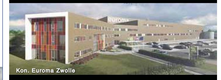
Kon. Euroma Zwolle