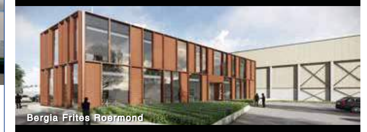
Bergla Frites Roermond